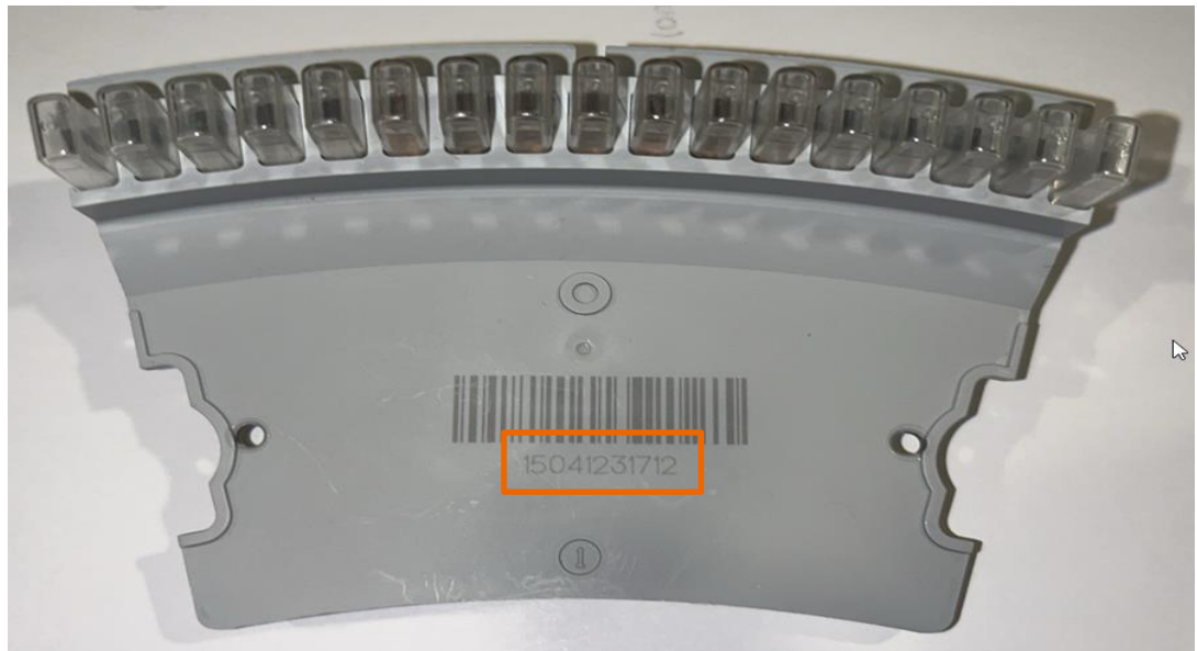
Abbildung 1. Position der Chargennummer am Atellica CH-Reaktionsring-Küvettensegment