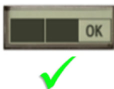
Figura 2: apparecchio pronto al funzionamento

Se l'indicatore di stato mostra "OK", gli apparecchi possono essere nuovamente utilizzati (Fig. 2). Tuttavia, se l'indicatore di stato mostra il simbolo della chiave inglese, gli apparecchi non possono più essere utilizzati (Fig. 3).