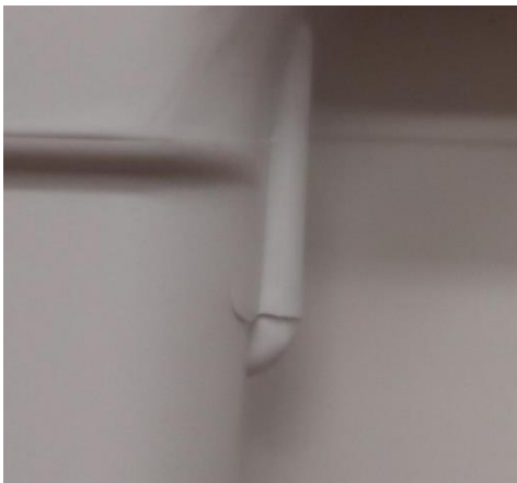
Rissbeispiel an einer Intellipack Verpackungsschale