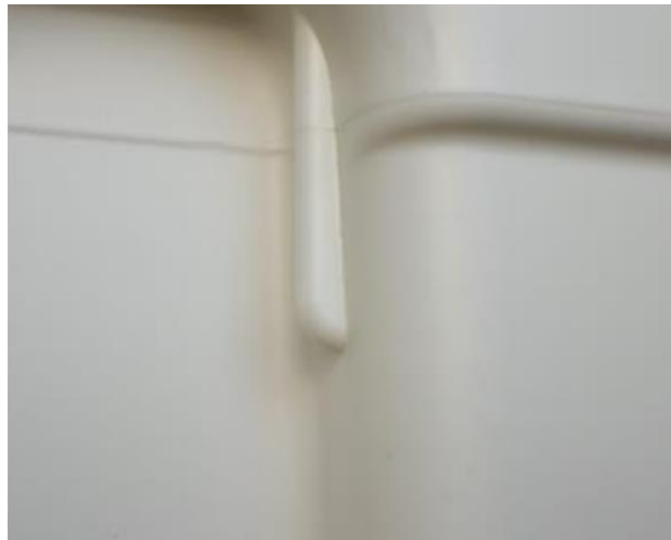
Unbeschädigte, unbelastete Intellipack Verpackungsschale