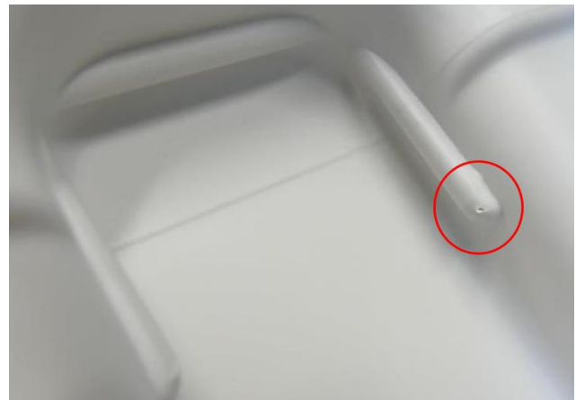
Rissbeispiel an einer Intellipack Verpackungsschale

Fehlerbild 2 (HLS): Schäden an der Sekundärverpackung, verursacht durch einen Fehler im Produktionsprozess in Kombination mit worst-case Transportbedingungen.