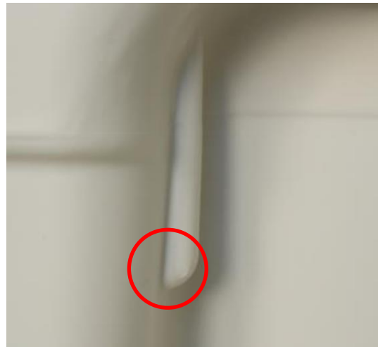
Weißer Spannungsspuren auf der Intellipack Verpackungsschale