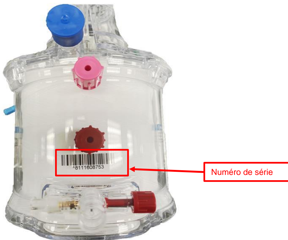
Image 2 – Emplacement du N° de série sur l'oxygénateur Affinity Fusion

Au moment de l'installation, localisez le numéro de série du produit concerné en vous référant à l'image ci-dessous.