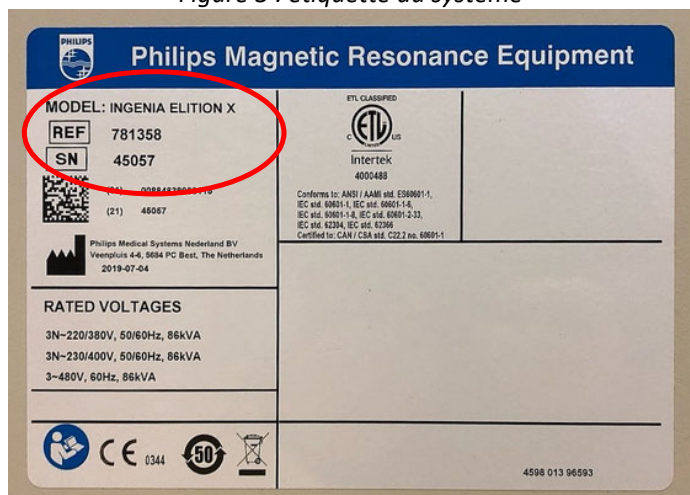
Figure 3 : étiquette du système