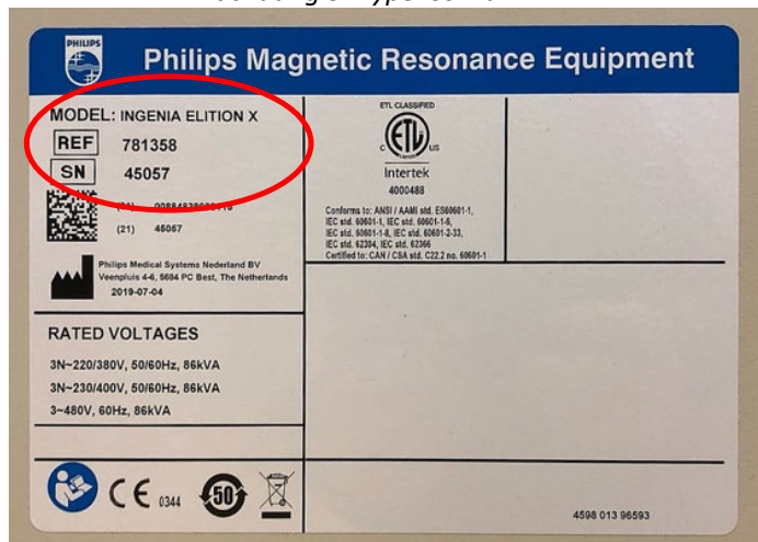
Abbildung 3: Typenschild