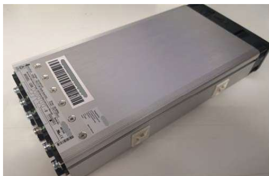
Figure 1: Bloc d'alimentation non conforme

Cet arrêt résulte de l'interruption de l'alimentation en énergie causée par un composant défectueux à l'intérieur du bloc d'alimentation.