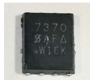
Figure 2: Composant défectueux