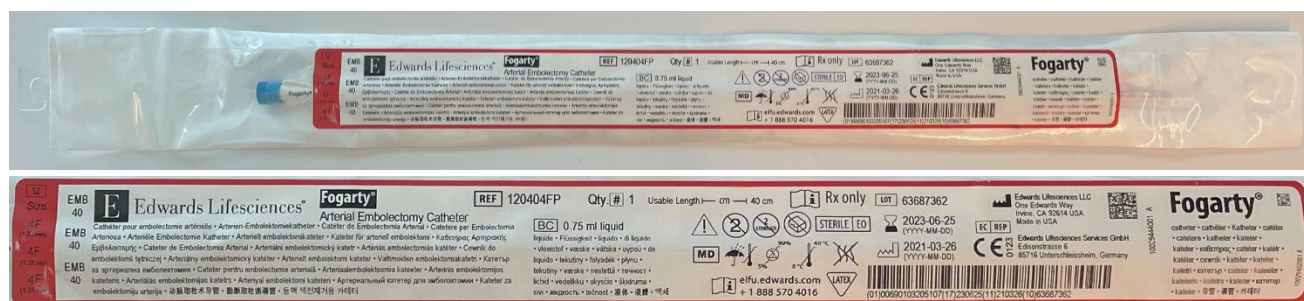
Figura 1: esempio di catetere per embolectomia arteriosa Fogarty confezionato in una busta