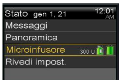
MiniMed™ 770G, MiniMed™ 740G, MiniMed™ 720G, MiniMed™ 700