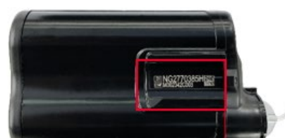
Inciso al laser

Custodia del microinfusore precedente (sinistra) e microinfusore con la nuova custodia (destra)