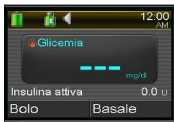
MiniMed™ 770G, MiniMed™ 740G, MiniMed™ 720G, MiniMed™ 700