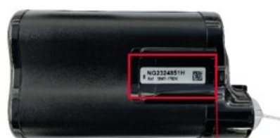
Adesivo color argento