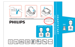
M5072A Sachet en aluminium