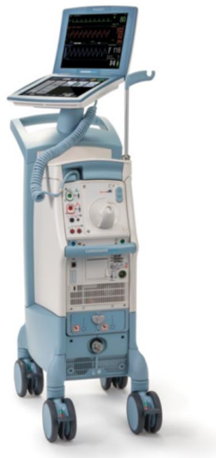
Figura 3: Cardiosave in configurazione Hybrid