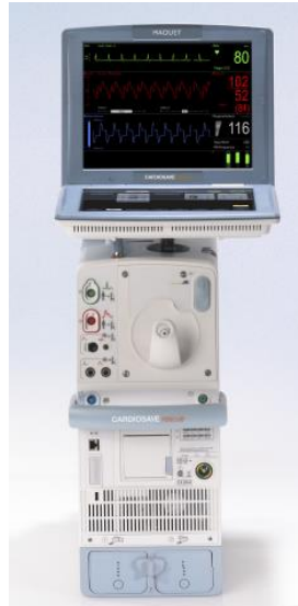
Figura 4: Cardiosave in configurazione da trasporto

Non può verificarsi uno spegnimento imprevisto alla rimozione della batteria per Cardiosave Rescue.