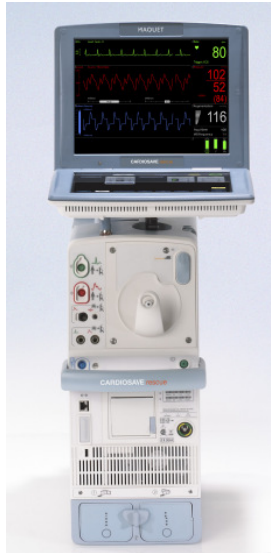
Figura 4: Cardiosave nella configurazione da trasporto

Non si può verificare uno spegnimento imprevisto alla rimozione della batteria per Cardiosave Rescue.