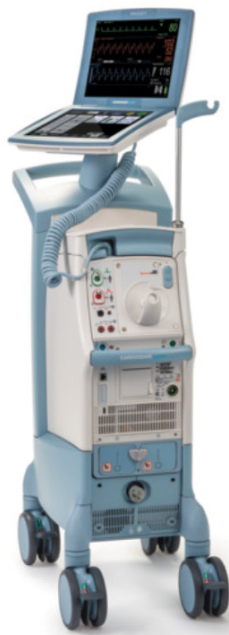
Figura 3: Cardiosave in configurazione Hybrid