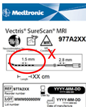
Image 1 : Étiquetage avec des informations d'espacement incorrectes

Medtronic a identifié que des numéros PIN spécifiques de kits d'électrodes Vectris SureScan MRI contiennent des informations incorrectes sur l'espacement des électrodes imprimées sur l'étiquetage de la boîte et de l'emballage stérile. L'étiquetage indique un espacement de 1,5 mm entre les électrodes, alors qu'il devrait en fait indiquer 4,0 mm. L'indication de 4,0 mm entre les électrodes des références catalogue 977A260, 977A275 et 977A290 est exacte, mais l'image est incorrecte. À la date du 7 juin 2021, Medtronic a reçu deux réclamations en lien avec ce problème, aucune n'a signalé de préjudice pour le patient. L'information incorrecte sur l'espacement des électrodes imprimées pourrait entraîner un désagrément pour l'utilisateur, une situation nécessitant un dépannage supplémentaire ou un allongement potentiel de la procédure chirurgicale.