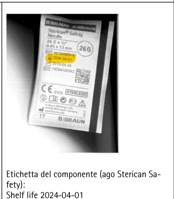
Etichetta del componente (ago Sterican Sa- fety): Shelf life 2024-04-01

L'uso di un ago Sterican Safety per iniezione oltre la shelf-life comporta un rischio minimo. Eventuali lesioni ai pazienti sono molto improbabili. In questa situazione consigliamo di attuare le misure indicate di seguito.