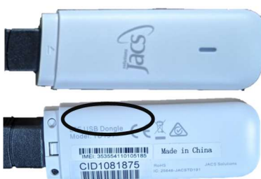
Figura 1. Immagini fronte/retro dell'adattatore per cellulare 4G LATITUDE MIMIC; l'etichetta CID include il numero di serie.