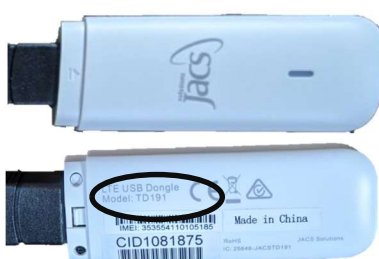
Figura 1. Immagini fronte/retro dell'adattatore per cellulare 4G LATITUDE MIMIC; l'etichetta CID include il numero di serie.