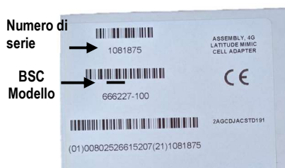
Figura 2. Etichetta della confezione dell'adattatore per cellulare 4G LATITUDE MIMIC; il modello BSC (Boston Scientific) è il 6227.