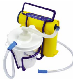
LCSU 4 800 ml canister version

Im Anhang erhalten Sie eine Auflistung der an Sie gelieferten Geräte, welche von diesem Sicherheitshinweis betroffen sind.