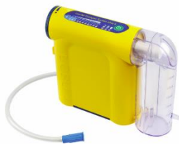
LCSU 4 300 ml canister version

Im Anhang erhalten Sie eine Auflistung der an Sie gelieferten Geräte, welche von diesem Sicherheitshinweis betroffen sind.