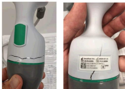
Abbildung 1: Beispiel für einen Schallkopfgriff mit Rissen

BladderScan, BladderScan Prime Plus, Verathon und das Verathon Fackel-Symbol sind Marken von Verathon Inc. ©2020 Verathon Inc. LTR-0051-DEDE Rev-00