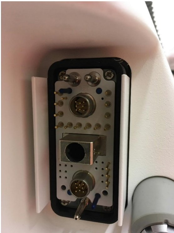
Abbildung 3: X10-Anschluss ohne eingesteckten Hauptkabelstecker (Beispiel)