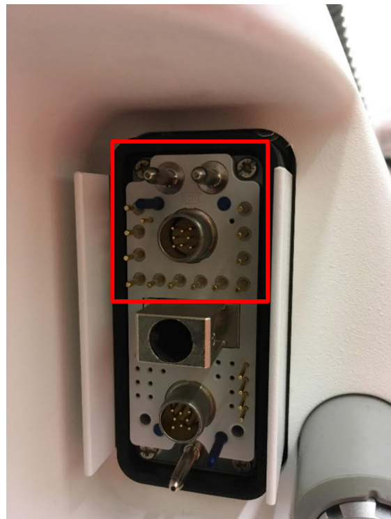
Abbildung 2: Kontaktstiftbereich des X10-Anschlusses, der nicht berührt werden darf (Beispiel)