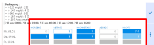
Korrekte Darstellung der Stellliste in vorhergehenden Versionen