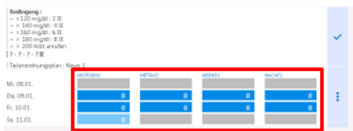
Inkorrekte Darstellung der Stellliste in den o.a. Versionen

Es handelt sich hierbei um ein unerwünschtes Verhalten, welches den Anwender unter Umständen fehlleiten und gegebenenfalls zu einem potenziellen Risiko für die Patientensicherheit führen könnte. Dies könnte insbesondere dann passieren, wenn die Dosierungsbedingungen, die oberhalb der zu verabreichenden Dosen dargestellt sind, nicht beachtet werden und folglich eine falsche Dosis vorbereitet und verabreicht wird.