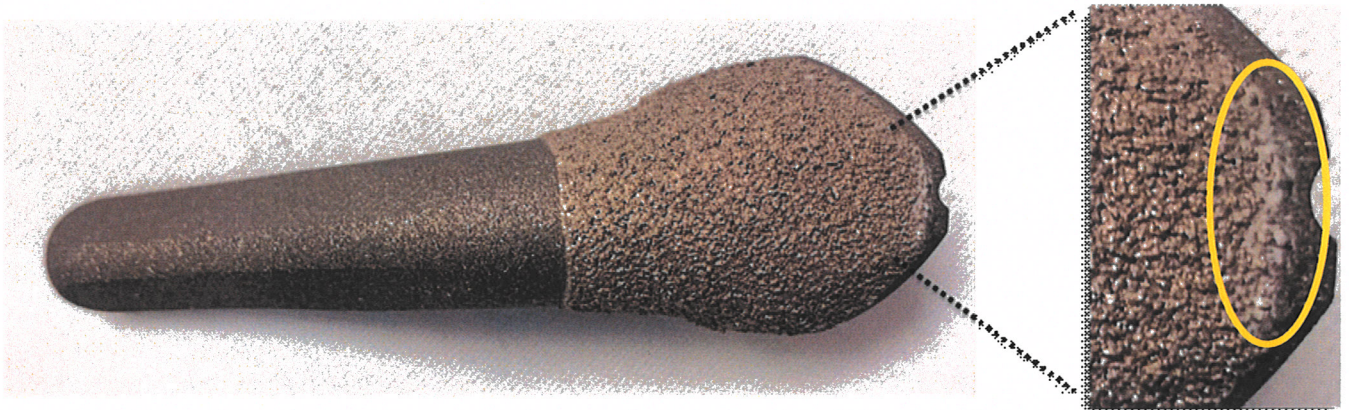
Fig. 2: Residui di PETG su steli PTC (Particelle)

I residui appaiono come un film di sottili scaglie di plastica