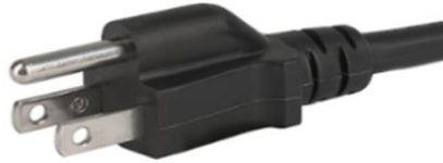
Figura 3: NON USARE ASSOLUTAMENTE spina di tipo B in Perù, Filippine e Thailandia.