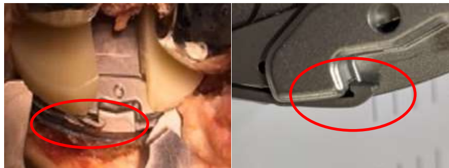
Non completamente inserito