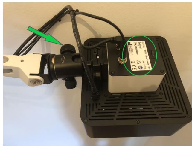
Abbildung 2: Der grüne Pfeil markiert die zu bedienende Schraube am Kugelkopf, um die Kamera zu positionieren; der grüne Kreis markiert das Typenschild, auf dem Sie die Seriennummer finden

Bitte füllen Sie das Bestätigungsformular zum Erhalt und zur Durchführung der Maßnahmen aus und senden es an eine der unten aufgeführten Kontaktpersonen.