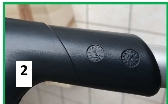
Beispiel: nicht zurückgerufene Produkte 2 Produktionsdaten