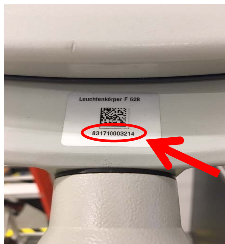
Figure 2: numéro de série du couvercle d'ampoule F 528/F 628