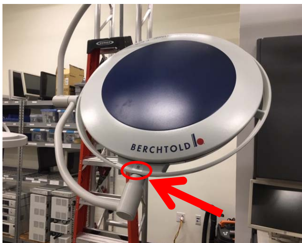
Figure 1: ampoule F 528/F 628 avec couvercle d'ampoule affecté