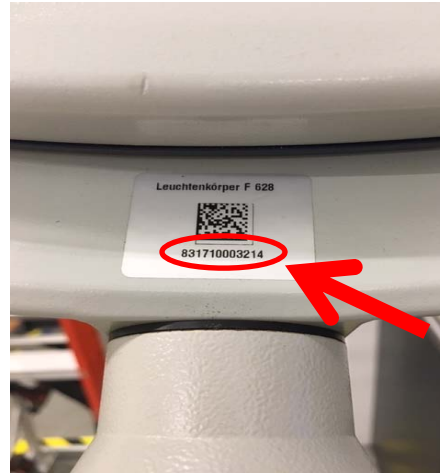
Abb. 2: Seriennummer der Beleuchtungskörper-Abdeckungen F 528/F 628