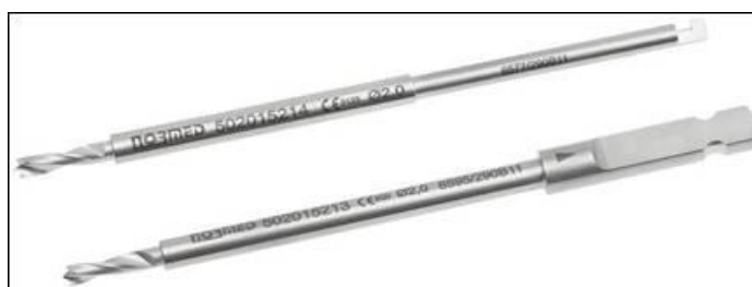
Figure 2 : Vue des forets