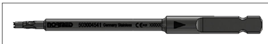
Figure 1 : Vue de l'instrument à fraise avec AO

Fabriqués par Normed Medizin Technik GmbH (comme indiqué à l'annexe 2)