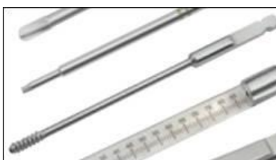
Figure 3 : Vue d'un taraud

Zimmer GmbH conduit actuellement une action de sécurité (retrait) relative à des dispositifs médicaux portant sur des instruments spécifiques antérieurement fabriqués et marqués par Normed Medizin Technik GmbH conformément à l'annexe 2. Tous les lots fabriqués par cette société sont inclus dans le périmètre de cette action de sécurité. Seuls les instruments marqués du nom/logo « Normed » font l'objet de cette action de retrait. Les produits potentiellement concernés peuvent être reconnus comme indiqués en annexe 1 (soit directement avec le marquage sur les instruments non stériles ou sur les étiquettes pour les instruments stériles). Veuillez contacter votre représentant Zimmer Biomet si vous avez de quelconques difficultés afin d'identifier les instruments potentiellement concernés. Il se fera un plaisir de vous assister.