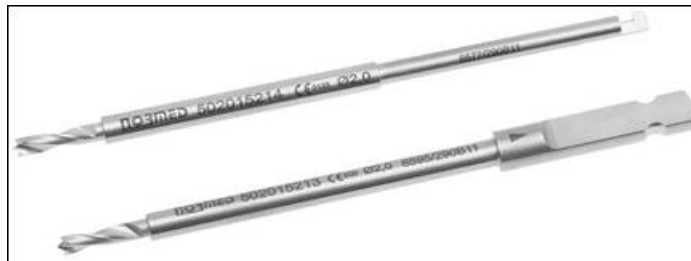
Abbildung 2: Ansicht der Bohrer