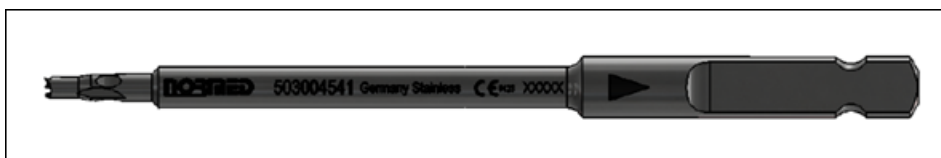
Abbildung 1: Ansicht des Kopfraumfräasers mit AO

Hergestellt von der Normed Medizin-Technik GmbH (wie in Anhang 2 aufgeführt)