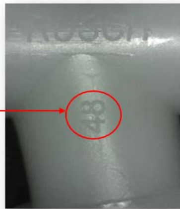
Figura 1 - Connettore Cobb