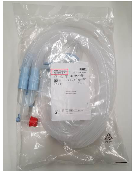
Position der Materialnummer Emplacement de la référence produit Posizione de numeri materiali