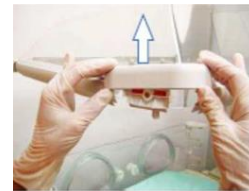
Abbildung 1 Verbesserte Haubendichtung

Hinweis: Wenn die Original-Haubendichtungen vorhanden sind und falls es zur Erzielung sichtbarer Sauberkeit erforderlich sein sollte, können Sie sich an Ihre Biomedizinische Abteilung oder an die GE Healthcare Kundendienstmitarbeiter bezüglich des Aus- und Wiedereinbaus der Haubendichtungen wenden.